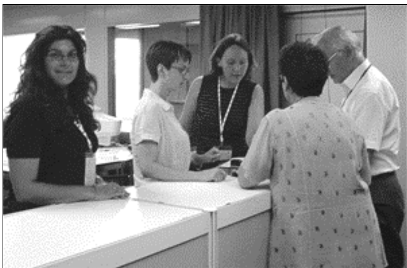
Das Voting Office