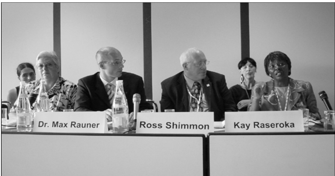
Pressekonferenz am Montag