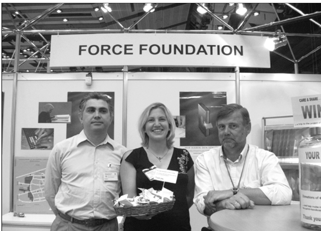
Eindrücke von der Ausstellung