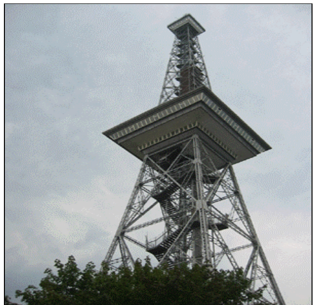
Dies ist nicht der Eiffelturm!

INIST (Institut de l'Information Scientifique et Technique), Host von IFLANET, ist eine von mehreren französischen Institutionen und Bibliotheken, die sich in diesem Jahr auf der Ausstellung präsentieren. Weitere Forschungs- und Hochschulbibliotheken und Informationsdienstleister, die sich mit INIST den Stand M7 teilen, sind ENSSIB (École Nationale des Sciences de l'Information et des Bibliothèques) und ABES (Agence Bibliographique de l'Enseignement Supérieur), bei denen die SUDoc-Datenbank – der nationale Verbundkatalog der wissenschaftlichen Bibliotheken Frankreichs – aufliegt. Das Ministerium für Kultur und Kommunikation, die Direction du Livre et de la Lecture und die Bibliothèque Publique d'Information (BPI) präsentieren sich zusammen mit der Bibliothèque Municipale und der Bibliothèque Départementales de Prêts, an Stand H38/H40. Die französische Nationalbibliothek finden Sie am Stand H32/H33.