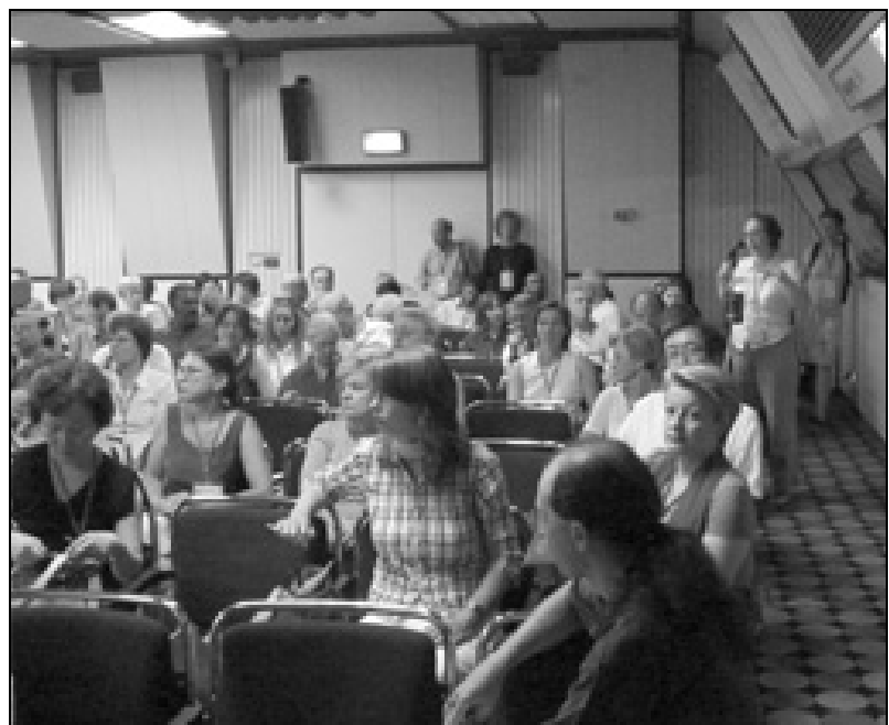
Sitzung Knowledge Management