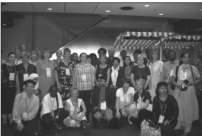
Los becarios del 2003

La reunión sirvió para que hicieran amistad con otras personas y recibieron consejos prácticos para su estancia en Berlín. Se hicieron muchas fotografías de recuerdo, que sin duda se incluirán en los informes sobre el congreso de la IFLA de vuelta a sus países.