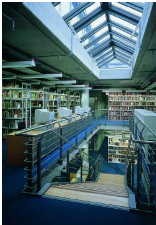
Munich, biblioteca universitaria

Cosas que solían llevar semanas de trabajo se hacen ahora en un momento, gracias a la electrónica: a través de los préstamos interbibliotecarios alemanes y varios servicios de suministro de documentos, uno puede pedir, en papel o formato electrónico, prácticamente cualquier publicación que deseemos y no esté disponible en nuestra biblioteca local. Una red de seis oficinas centrales coordina el préstamo interbibliotecario, recoge y almacena todos los datos relacionados con los fondos de las bibliotecas universitarias y los hace públicos a través de internet en forma de "catálogo virtual".