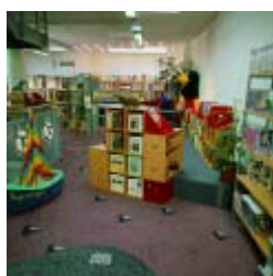
Bernburg, biblioteca municipal (sección infantil)