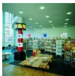
Westerstede, biblioteca municipal