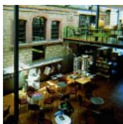
Landau, biblioteca municipal

Las bibliotecas se están enfrentando al reto de proporcionar información, medios y servicios para la era moderna, y ya ha pasado mucho tiempo desde que sólo contaban con libros y revistas. Ahora también hay juegos, CD-Roms, películas, DVDs, libros de audio y cualquier otro soporte. La capacidad para leer y tomar parte en el aprendizaje, ser competente en el uso de medios y las habilidades técnicas para saber investigar y reconocer de forma crítica la información son técnicas culturales básicas. Todos las necesitamos urgentemente para ser capaces de enfrentarnos a la escuela, formación, trabajo y al mundo cotidianos.