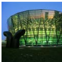
Dortmund, biblioteca municipal y regional

La Bundesvereinigung Deutscher Bibliotheksverbände e.V. - BDB (Asociación Federal Alemana de Asociaciones de Bibliotecarios) situada en Berlín, es la articulación principal de una asociación que representa los intereses de aquellas asociaciones e instituciones relacionadas con el mundo bibliotecario. Entre sus miembros están: Deutscher Bibliotheksverband e.V. - DBV (Asociación Alemana de Bibliotecarios), Berufsverband