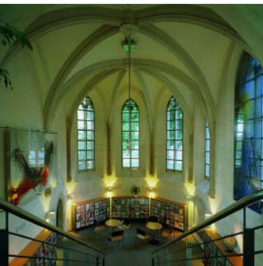
Halberstadt, biblioteca municipal

En Alemania hay aproximadamente 10.200 bibliotecas públicas y 4.000 universitarias. Están financiadas y mantenidas por las administraciones municipales y el Federal Länder (Estado Federal), así como por la Iglesia y fundaciones e instituciones privadas. La descentralización está teniendo un marcado efecto en el sistema bibliotecario (a diferencia de otros países, no hay leyes sobre bibliotecas en Alemania, ni una administración central por parte del estado ni ninguna institución privada). Esta situación es producto de razones históricas, ya que la responsabilidad en asuntos culturales, académicos, artísticos y educativos siempre ha recaído en el Estado. Las administraciones municipales también comparten esta soberanía cultural, sus competencias voluntarias incluyen actividades como el mantenimiento de teatros, museos y bibliotecas.