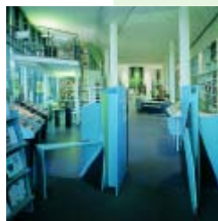
Stuttgart, biblioteca municipal (sección música)