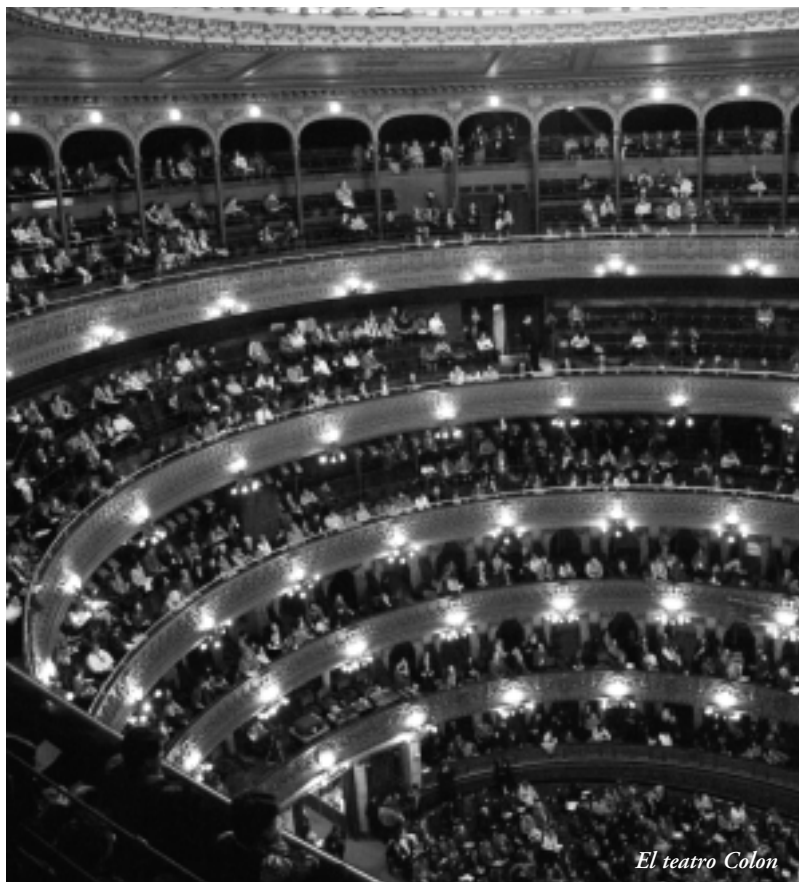
El teatro Colon