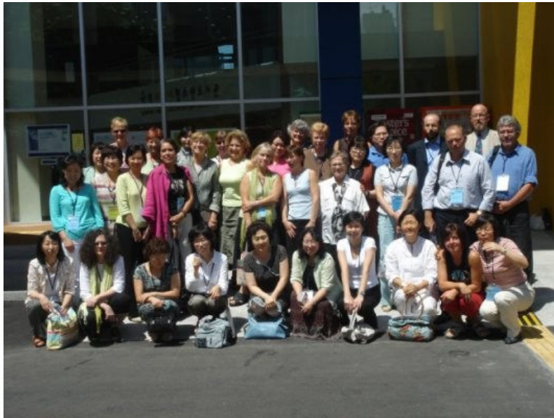
Mitglieder der Sektion 13 beim Vortreffen vom 16. bis 18. August in der koreanischen Nationalbibliothek für Kinder und Jugendliche

Ein weiteres Jubiläum ist zu feiern: Die 1976 gegründete Sektion 13 Acquisition and Collection Development feiert ihr 30jähriges Bestehen. Unter dem "Evolving business models for hybrid collections" veranstaltet sie zusammen mit der Sektion 16 Serials and Other Continuing Resources in Raum 105 ein Programm.