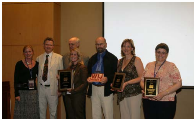
- 4. IFLA International Marketing Award -

In der IFLA-Express Ausgabe Nr. 6 (Mittwoch, 23. August 2006) wurde dieses Bild mit einer falschen Bildunterschrift ausgedruckt. Die IFLA-Express-Redaktion entschuldigt sich bei allen Betroffenen, was selbstverständlich den Sponsor, SirsiDynix mit einschließt. Die richtige Bildunterschrift wird daher hier nachgereicht: