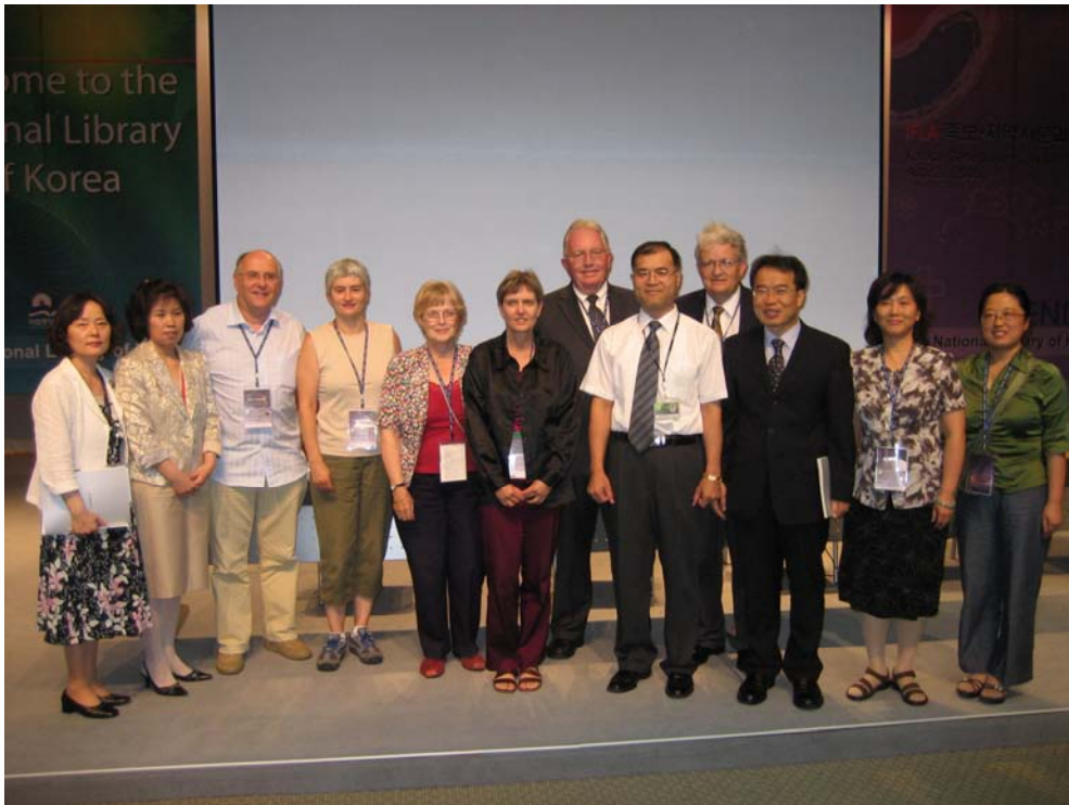
- Die Sprecher des Standing Committee Genealogy and Local History -

Der Workshop 'Korean Genealogy: A Dynamic Tradition', der am 21. August von der koreanischen Nationalbibliothek für die Sektion Genealogy and Local History in ihren Räumen ausgerichtet wurde, zählte 80 internationale und koreanische Teilnehmer.