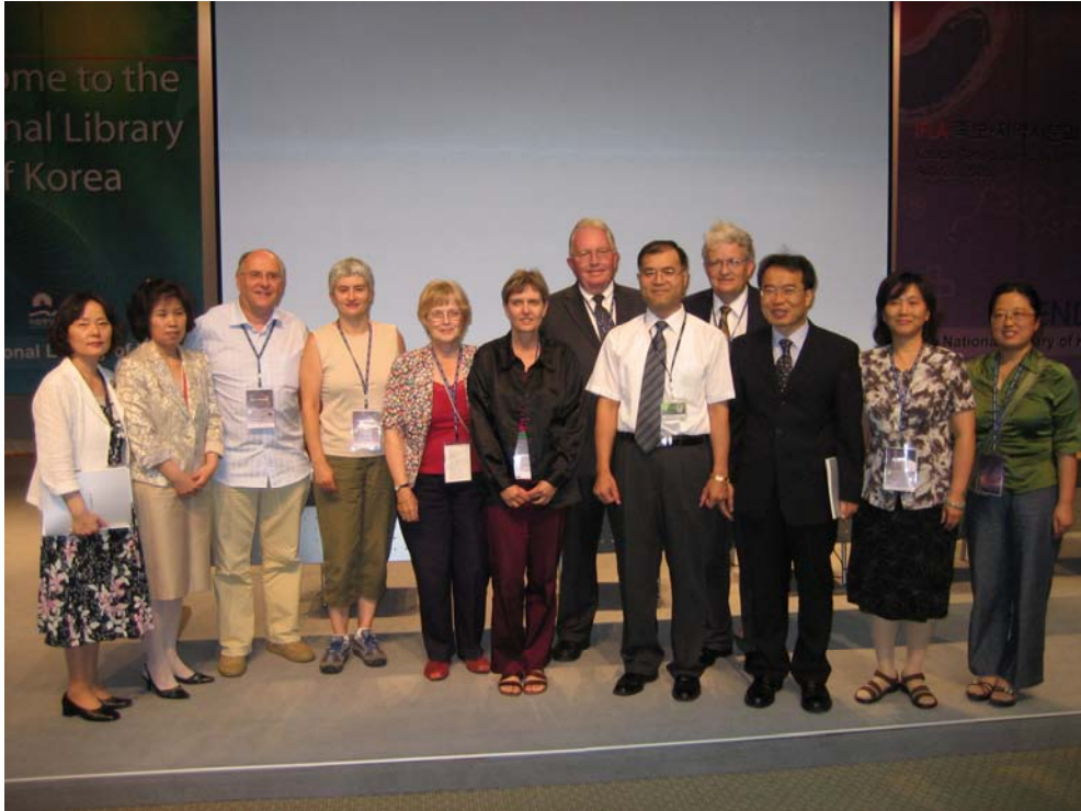
-상임 위원회의 연설자들-

국립중앙도서관이 족보와 지방사 분과를 위해서 개최한 “한국의 족보. 역동적 전통” 워크숍이 8월 21일 80여명의 세계 각국 및 한국 참석자들이 모인 가운데 개최되었습니다.