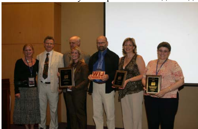
- Четвертая международная премия по маркетингу

В 6-м номере ИФЛА Экспресс (вышедшем в среду, 23 августа 2006г.) подпись под этой фотографией была неверной. Приносим свои извинения всем и, в первую очередь, спонсору - компании SirsiDynix. Правильная подпись дана здесь.