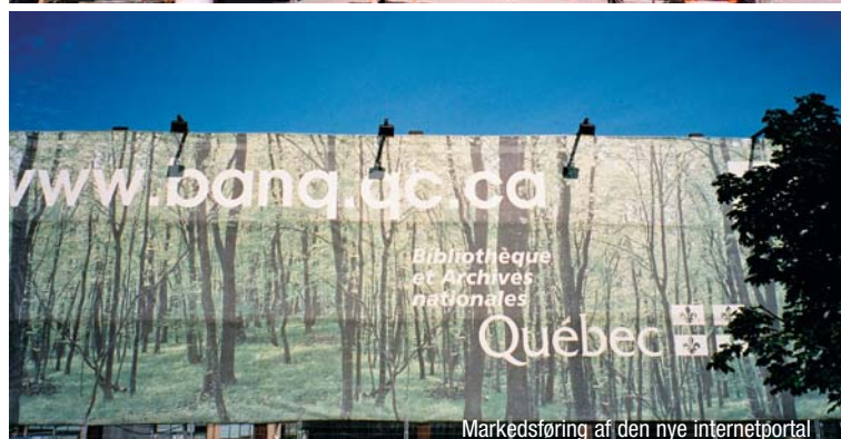
Markedsføring af den nye internetportal