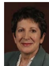
Lise Bissonnette, CEO Bibliothèque et Archives nationales du Québec