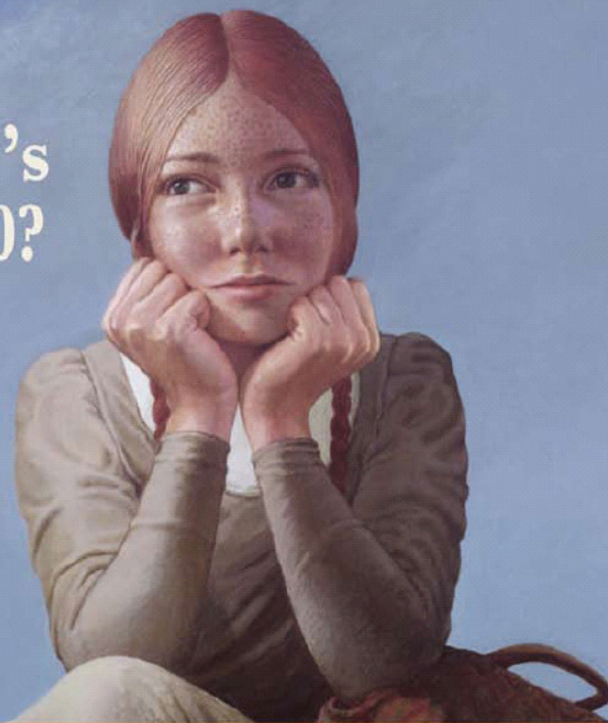
© Canada Post Corporation, 1975 stamp