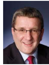
Régis Labeaume, Bürgermeister der Stadt Québec