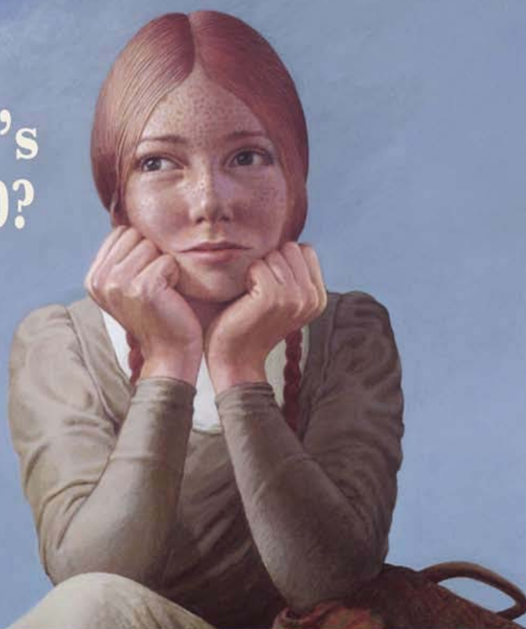
© Canada Post Corporation, 1975 stamp