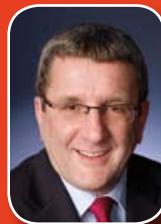
Sr. Régis Labeaume Alcalde de Québec