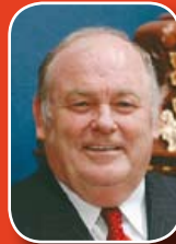
Sr. Michel Bissonnet Presidente National Assembly of Québec