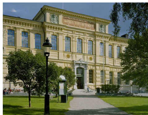
Kungl. Biblioteket, Bibliothèque nationale de Suède (Lindman)

Dans le cadre d'une initiative conjointe de la Bibliothèque royale, de la Bibliothèque nationale de Suède, du Musée national de Suède, de la Commission du patrimoine national, des Archives nationales de Suède et du Conseil des affaires culturelles, un nouveau secrétariat, « ABM-centrum », a été mis sur pied en 2004. Tel qu'indiqué en ligne dans l'énoncé de sa mission, « ABM-centrum: Mission statement », son principal objectif est de promouvoir la compréhension et la collaboration entre les archives, les bibliothèques et les musées, en mettant l'accent sur l'élaboration de projets numériques.