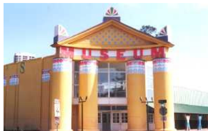
Parent Resource Library, tiré de « About us: The Children's Museum of Houston »

La Parent Resource Library, située dans le Children's Museum of Houston, a ouvert ses portes au printemps 1999. Gérée comme une succursale de la bibliothèque publique de Houston, les objectifs de la bibliothèque, selon la page Web « Parent Resource Library - The Children's Museum of Houston », constituent « une ressource complète pour les parents sur toutes les questions et les préoccupations entourant la jeune enfance ». Les sujets qui sont traités dans la collection vont de l'apprentissage de la propreté, à la discipline en passant