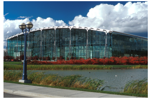
Bibliothèque et Archives Canada, Centre de conservation, à Gatineau, au Québec.