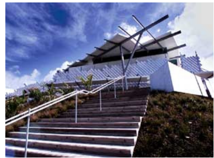
Puke Ariki Museum and Library, tiré de « Puke Ariki - About Puke Ariki »

Selon la page « Puke Ariki - About Puke Ariki » de son site Web, le Puke Ariki Knowledge Center, à New Plymouth, en Nouvelle-Zélande, est une bibliothèque, un musée et un centre d'information au visiteur entièrement intégrés. L'intégration complète permet à l'institution de présenter les collections du musée de façon interactive et permet au Knowledge Center de raconter l'histoire de la région.