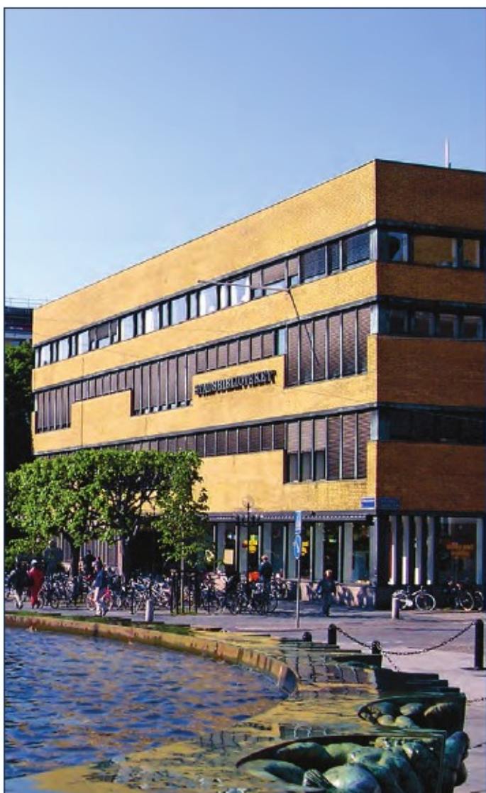
哥德堡公共图书馆

今年大会的一个新举措是给所有的国际图联代表提供了在大会期间自由访问各种图书馆的机会。会议中心所处的中心地段让您更方便的访问这些图书馆。我们会将本地区的所有图书馆标注在网站上，并在哥德堡现场标注，所有的大会代表将获得一份图书馆地图。