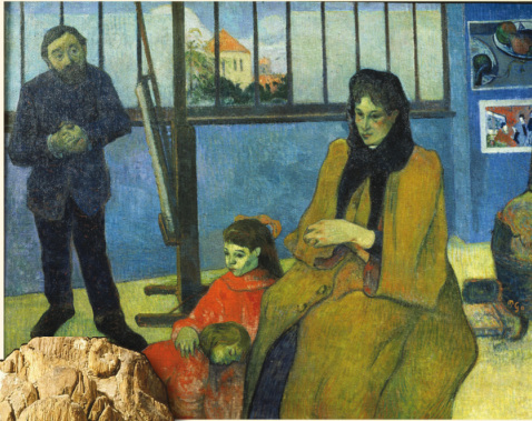
Family Schuffenecker, Gauguin, Reliquary Bust of Charlemagne, 1349, Cathedral Treasury, Aachen.

This rich art image database, available exclusively on WilsonWeb, now offers more than 155,000 works from an impressive roster of distinguished international museum sources.