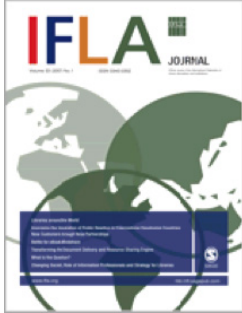
IFLA Journal, vol. 39, núm. 1

Este número incluye noticias de actividades recientes de la IFLA y artículos, seleccionados para reflejar la variedad de la profesión de información internacional, que van desde la libertad de información, preservación, servicios a débiles visuales y propiedad intelectual.