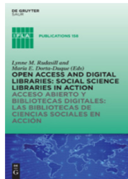
Open Access and Digital Libraries: Social Science Libraries in Action / Acceso Abierto y Bibliotecas Digitales: Bibliotecas de Ciencias Sociales

Las ciencias sociales han hecho contribuciones fundamentales para la comprensión de la vida social, política y económica de las naciones en el siglo pasado.