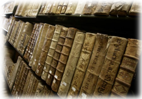
«Plan Nacional de Patrimonio bibliográfico»