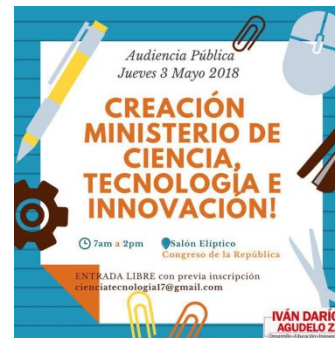
«Proyecto de Ley para la creación del Ministerio de Ciencia Tecnología e Innovación»