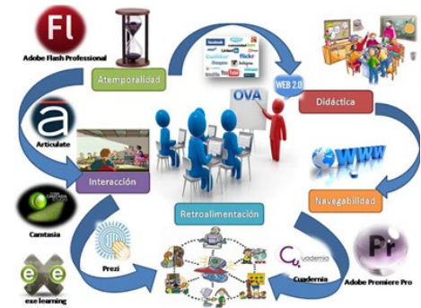
«Objetos Virtuales de Aprendizaje»