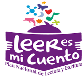
«Plan Nacional de Lectura y Escritura»