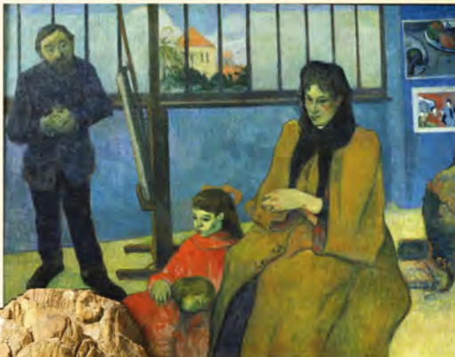
Family Schuffenecker, Gauguin. Reliquary Bust of Charlemagne, 1349, Cathedral Treasury, Aachen.

This rich art image database, available exclusively on WilsonWeb, now offers more than 155,000 works from an impressive roster of distinguished international museum sources.