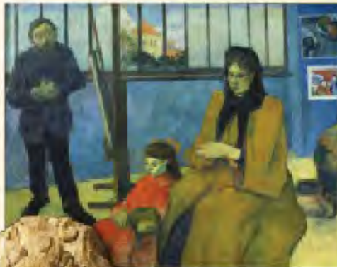
Henry Schaeffer's August Bergquist's Room of Gustavus, 1905.

This rich art image database, available exclusively on WilsonWeb, now offers more than 155,000 works from an impressive roster of distinguished international museum sources.