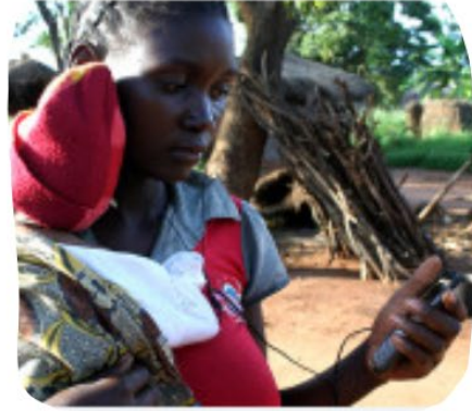
Information for Development