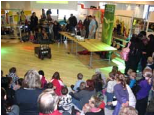
Big snakes inside the box!