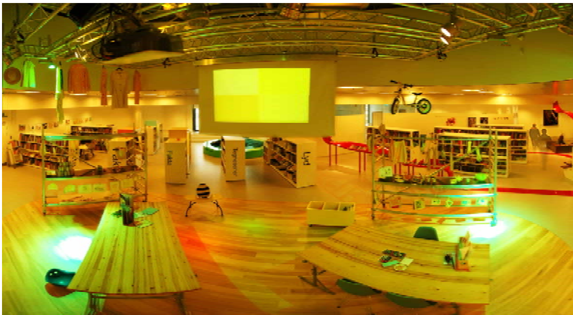
Panorama – Colour Yellow